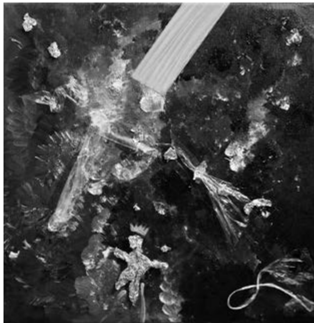
Meanwhile, 40 × 40 cm, akril, vászon, sztaniol

Én mindig hittem, és most is hiszem és vallom, hogy a művészember alkotó ember. Ezt úgy képzelem el, mint a világ bukását. A művész a világ min-