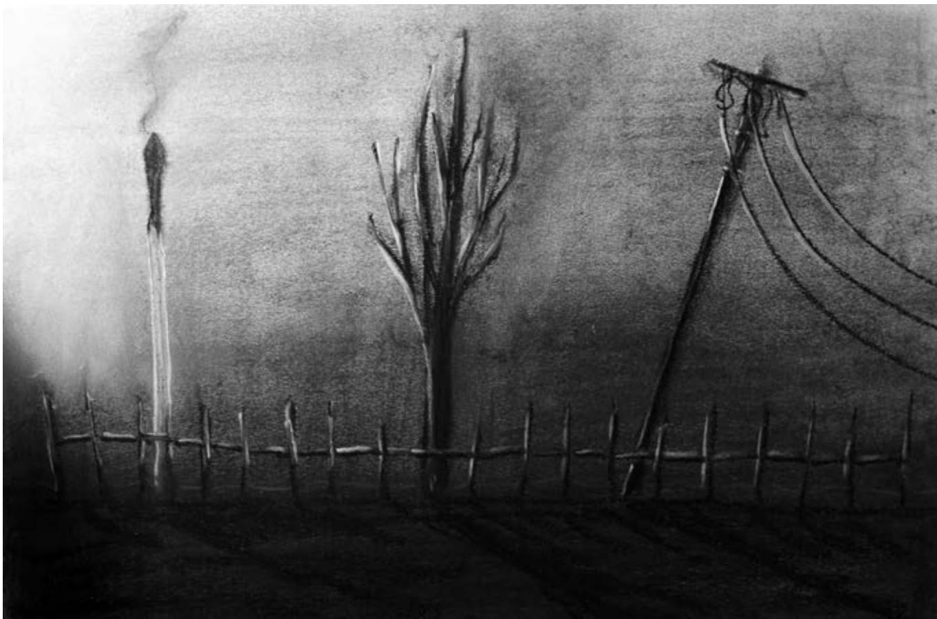
Humbug, 29 × 42 cm, pasztell, papír

den szennyét magába gyűjti, mert érzékenyen figyeli a világot, és hogy ebbe ne bolonduljon bele, az alkotásaiban adja vissza mindazt, amit magába szívtott.