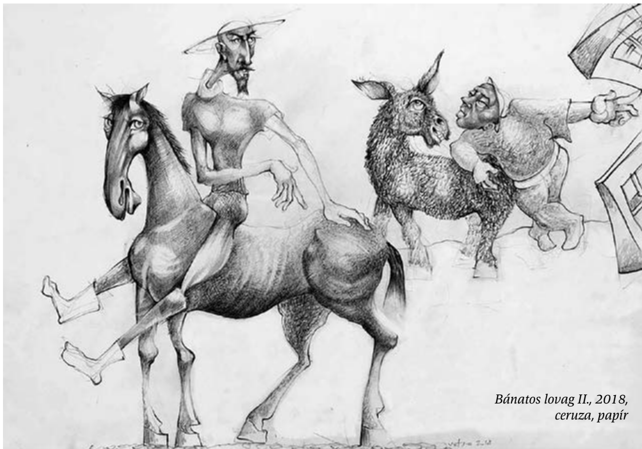
Bánatos lovas II., 2018, ceruza, papír