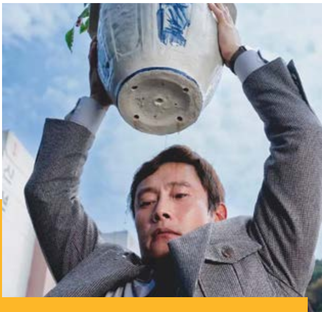
Megtegyem vagy ne tegyem meg? Man-su dilemmában