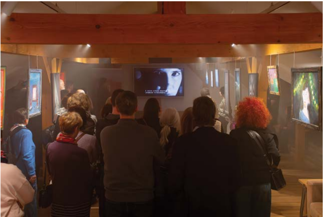
Versvideó-nézés a Fonák megnyitóján