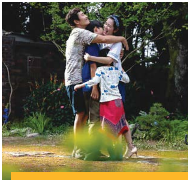
Idilli családi kép. Mindent megér?