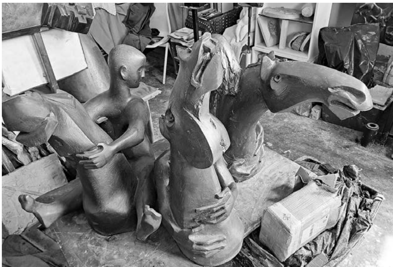
„Én már akkor is lovakat rajzolok, mintázok, amikor nem kényszerít rá semmi és senki”

velük, bizonyos dolgokra a munkáimmal kapcsolatos írásaikból figyelhettem fel. Az olvasmányaim is alaposan befolyásolnak. A jelképes beszéd, a metafora a képzőművészetben is meghatározó. Cervantes főművét nem csak az irodalomban, a társművészetekben is kifuttatták. Sokan megfestették, lerajzolták, szoborként mutatták fel Don Quijotet. Én nem sűríttem egyetlen műbe a témát, úgy tűnik, nem ér véget ez a dombormű-sorozatam sem. Sokszor rajzzal, a plasztika lelkületét grafikai látásmóddal is kivetítem a rajzlapra. A bánatos lovagot sokféle situációba helyezem. Ezeknek megfelelően változnak az érzelmei, hangulatai. Boldog, szomorú, csalódott, reménykedő, letört, győzedelmes. Megkínzott, megtépázott, napba néző, önérzetes ember. Úgy képzelem, ezek a szobrok tükörként is működnek, amelyekben a szemlélődők önmaguk legbensőbb rezdüléseire ismernek. De mindenekelőtt az én arcaimra, érzéseimre, belső vívódásaimra, mert ezeken a domborműveken nem kímélem önmagam. Mondtam már, idegenkedem a pátosztól, ahol módom van rá, az irónia és főleg az önirónia eszköztárát vetem be. Jelképesen ugyan, de olykor már-már pőrére vetkezem. A diktatúra lélekölő korszakában egyfajta védekezés is volt a Don Quijote-féle szemlélet. Ha a költők, drámaírók időnként a szerepjátszás köntösét