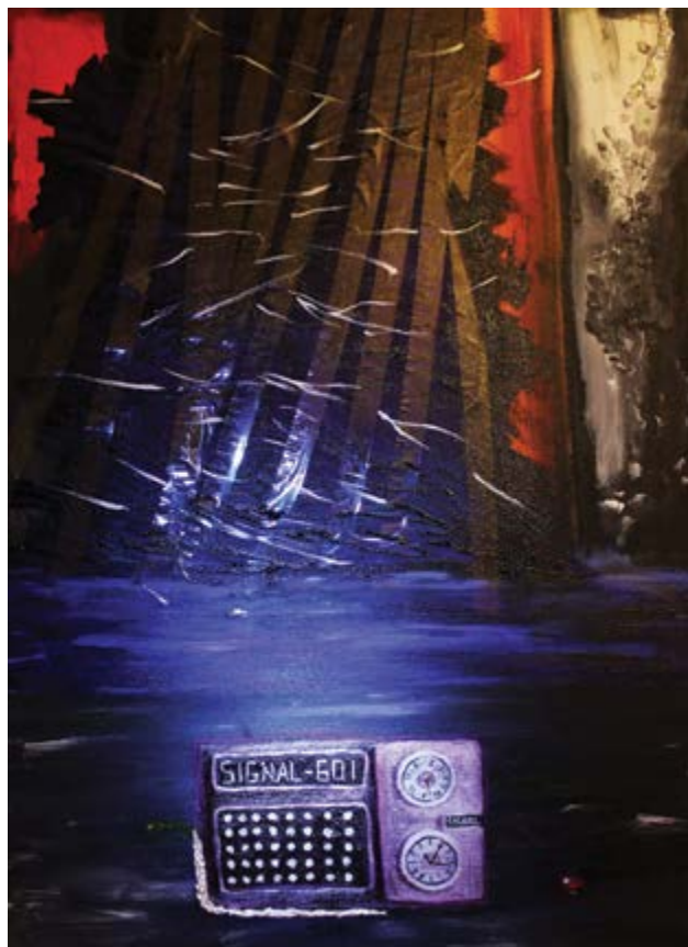
No Signal, 50 × 70 cm, akril, vászon