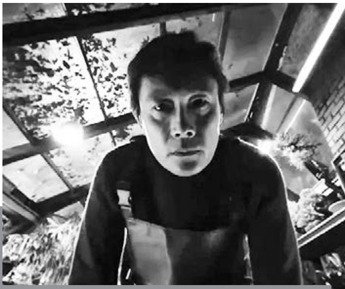
A melegházban sok a munka

Man-su (Lee Byung-hun) legalábbis nem lát kiutat, amikor 25 év munkaviszony után váratlanul elbocsátják a papírgyárból. Egyik percről a másikra minden megkérdőjeleződik a számára, amivel valaha azonosította magát. A gyönyörű családi ház, amelyet a jól fizető munkahelynek köszönhetően