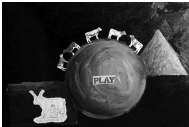
Play, 40 × 60 cm, akril, vászon, kollázs

Szeretettel várjuk Önöket, hogy nézzék meg ezt a rengeteg önarcképet, és utána sétáljanak a felsőbb régiókba, ahol egy két és fél perces versvideó közös megtekintésére várjuk Önöket. Köszönöm szépen és gratulálok még egyszer az őszinteségért és a bátorságért, hogy az alkotó merete így kiállítani önmagát.