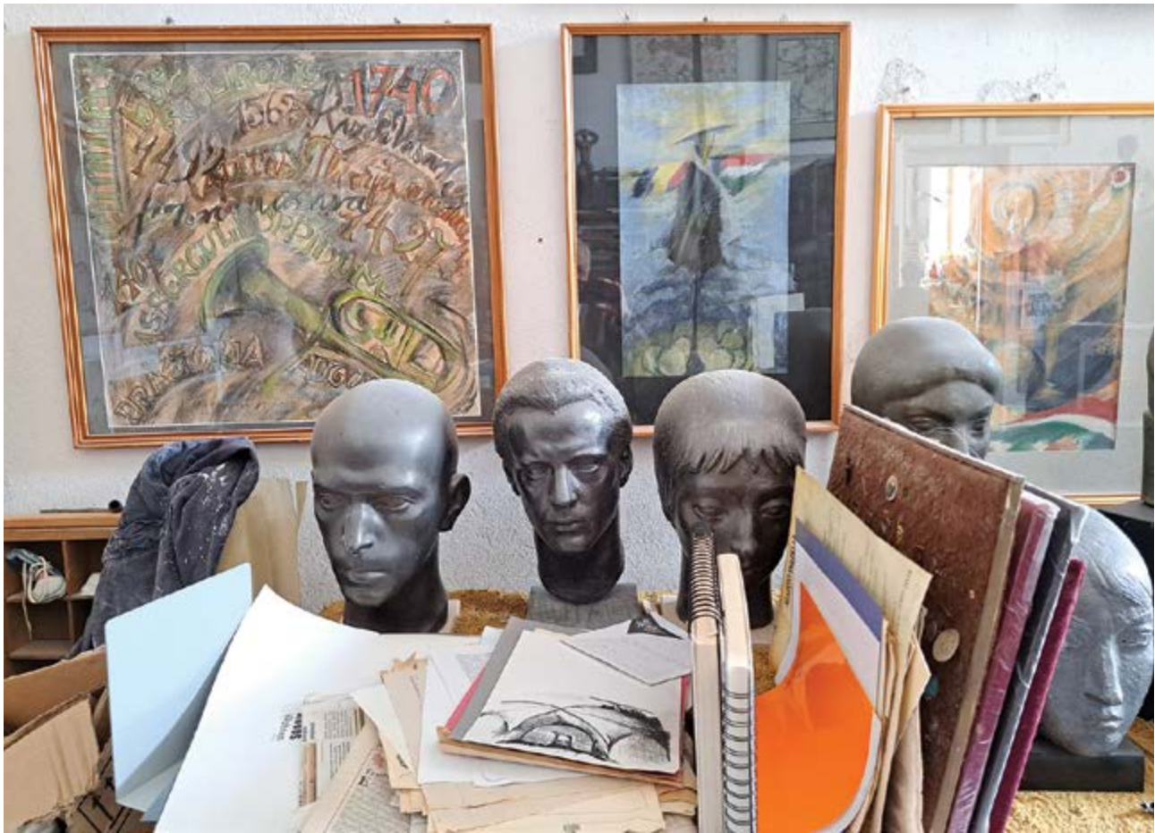
Vetro-fejek, -képek, -vázlatok, -jegyzetek a műteremben