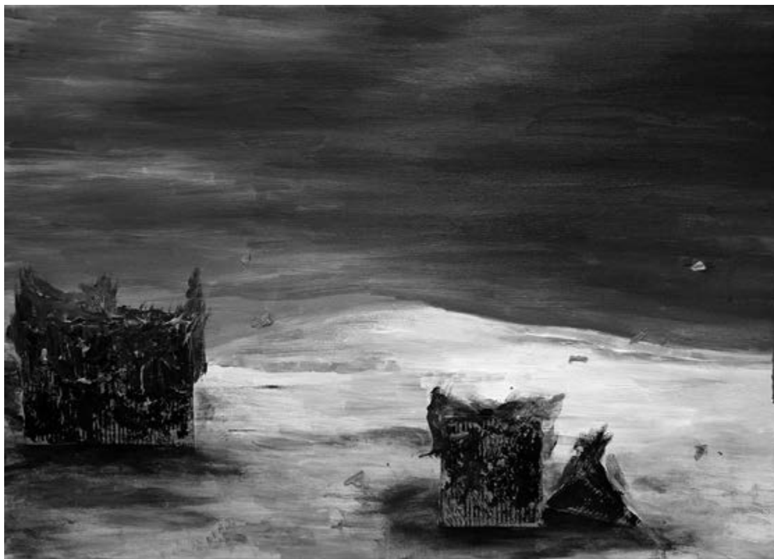
My House is Your House, 50 × 70cm, akril, vászon