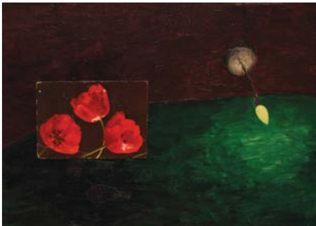
If You Ask Me, Light Wins, 30 × 40 cm, akril, vászon, képeslap

san változó jelenlétek. A tárlat külön érdekessége, hogy a festmények mellett videómunkák is szerepeltek. Ezek a mozgóképes alkotások hasonló szemléletet képviseltek: a lassúság, a rétegzettség és az érzéki bizonytalanság itt is meghatározó volt. A képi és szövegi rétegek egymásba fonódása tovább erősítette a kiállítás alapgondolatát: a belső folyamatok láthatóvá tételét. A kiállítás hangulatában érzékelhető némi filmes hatás is. Ozsváth egyik inspirációja David Lynch, akinek álomszerű, kissé nyugtalanító világa visszhangzik a térben. Ez nem konkrét