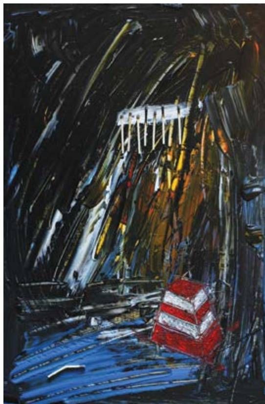
Pinched nerve, 30 × 40 cm, farostlemez