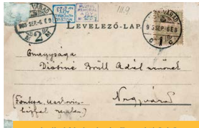
Az Ady által feladott levelezőlapon, a költő első küldeménye a Stern–Brüll-villába, a mai Lédaházba