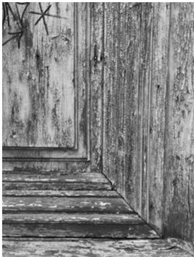
Eredeti illesztések egy historista kapun

sen itt is nemes, a szokás pedig egyre népszerűbbé válik, mert rendre, tisztaságra és új tárgyakra van igény.