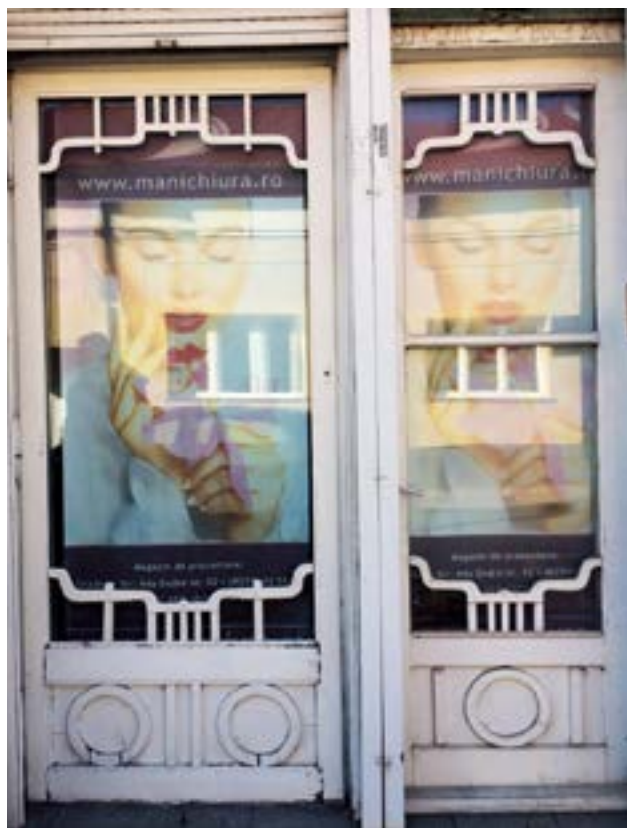
Újragyártott szecessziós kirakat a Szent János utcában

Mindenképp említést érdemel itt a Rulikowski temető neológ zsidó parcellájának a főbe-