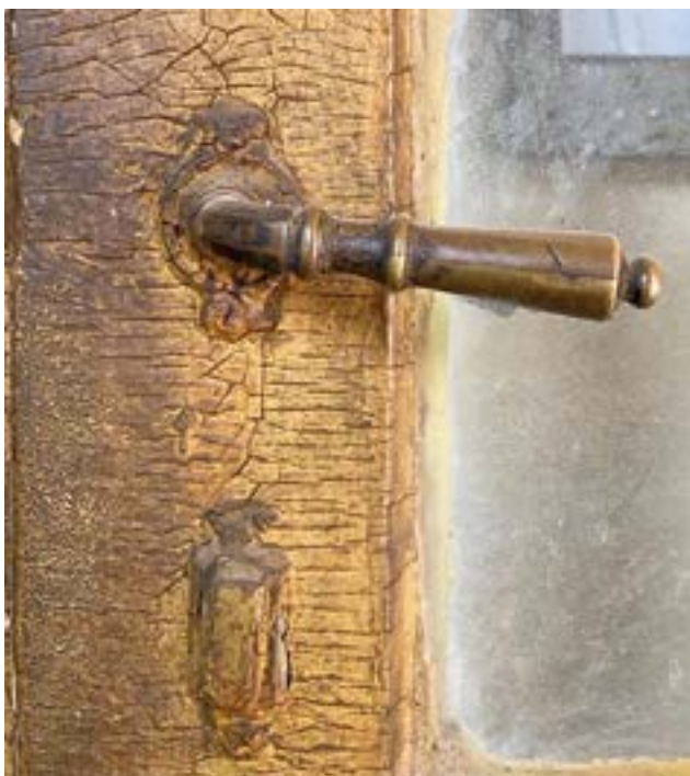
Kilincs és kulcslyuktakaró elem a 19. század közepéről

A Szent János utca 32. szám alatti szeccszíós kirakatdíszítés a huszadik század 90-es éveiben, vagy a kétezres években készülhetett. Itt néhány megmaradt elem viszont arra utal, hogy a minta, ami alapján gyártották, maga az eredeti kirakat volt. Az illesztések minőségén, az arányokon, a szegelésen és az elemek vastagságán látszik, hogy ez egy újragyártott kirakat. Erre bizonyítéku szolgál, egy egykori mezőtelegi patika nagyjából eredeti állapotban megmaradt bejárata, ezzel összehasonlítva válik nyilvánvalóvá, hogy a Szent János