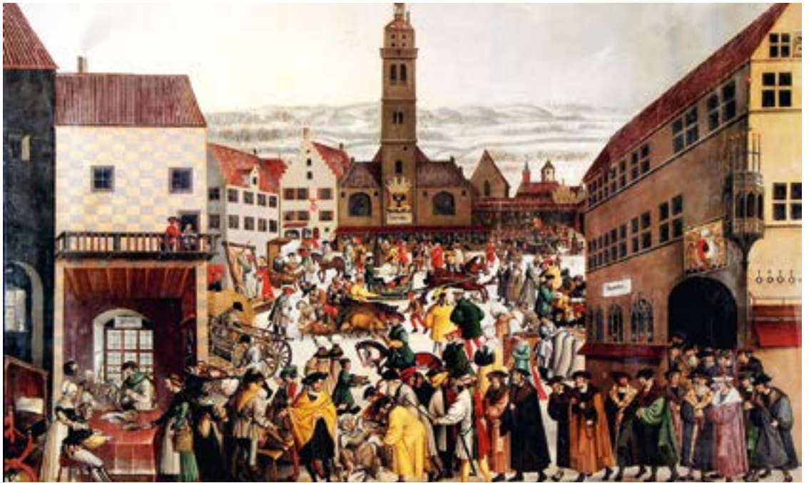
Késő középkori város és vására (Augsburg 1540 körül)

a Szent László király sírját felkereső zarándokok adományai is. E téren kiemelkedő jelentőségű volt az a mintegy 90 királyi zarándoklat, amelyek esetleg már a 11. század végétől, Imre király uralkodásától, de IV. László király uralmától kezdve mindenképp, lényegében a 16. század elejéig szinte valamennyi középkori uralkodónkat koronázásukat követően Váradra, Szent László király sírjához vezették.