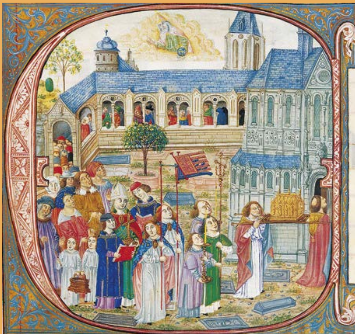
Középkori körmenet ábrázolása, előtérben az 1557-es váradi inventáriumban is említett magasszárú gyertyatartók (kódexminiatura, 15. század)