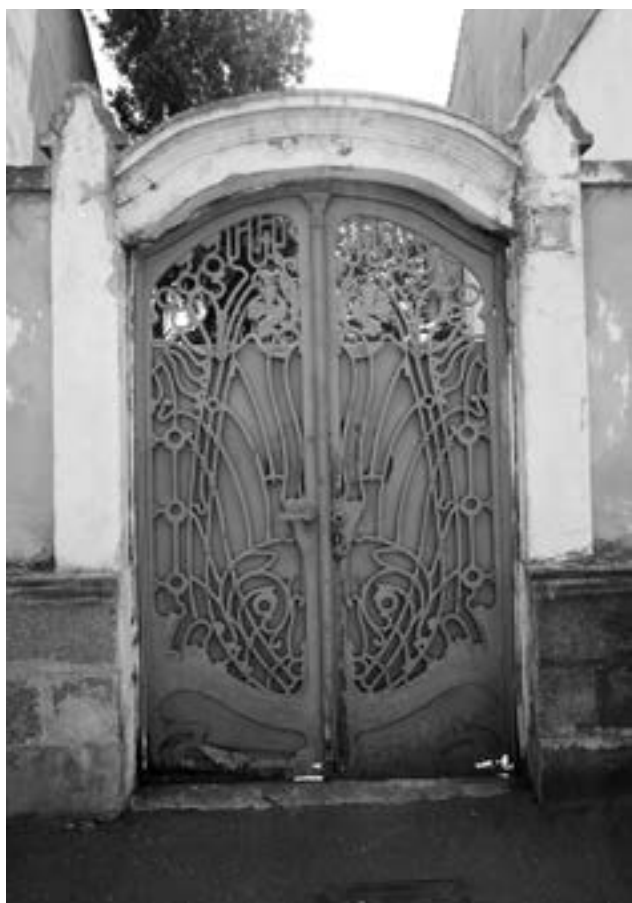
Szecessziós inspirációjú kapu a húszas évekből

A 19. század olcsóbb, de mindenképp praktikus megoldása volt, hogy a tömörfa léckapuk homlokzati oldalát lemezzel borították, majd lefestették. Az így elnyert, nagyon modernnek tűnő felület egyetlen dísze a szegecslés által létrehozott minta. Ezt a lehetőséget használták ki a belényesi medence bizonyos falvaiban, különös koncentrációban a várasfenesi népi iparművészetben, ahol előszeretettel szegecslés virágmintákkal és építési emlékfeliratokkal díszítették lemezkapukat. Nagyváradon, az egyszerűbb lemezfelületű kapuk mellett, amelyből több is van a Pavel utcán (17, 20), a Szaniszló (45), vagy a Szent János (Ady Endre) utcán is (14), egyetlen virágdíszítésű lemezkapu van, a Csengery (Delavrancea) utca 26 szám alatt. Az 1889-es évszámot is szegecsléssel jegyezték fel rá. Ezeknek a kapuknak a hiányossága, hogy alapvetően nem látványosak és megfelelő karbantartás híján látszólag nem is igényesek, így sokkal kiszolgáltatottabbak a felújításoknak, mint a historista kapuk. A Pavel utca 17. szám alatt, egy szecessziósként újragondolt 19. századi ház lemezkapuja például deklasszált öregként éli végnapjait faoszlopra és téglákra támaszkodva, közel-