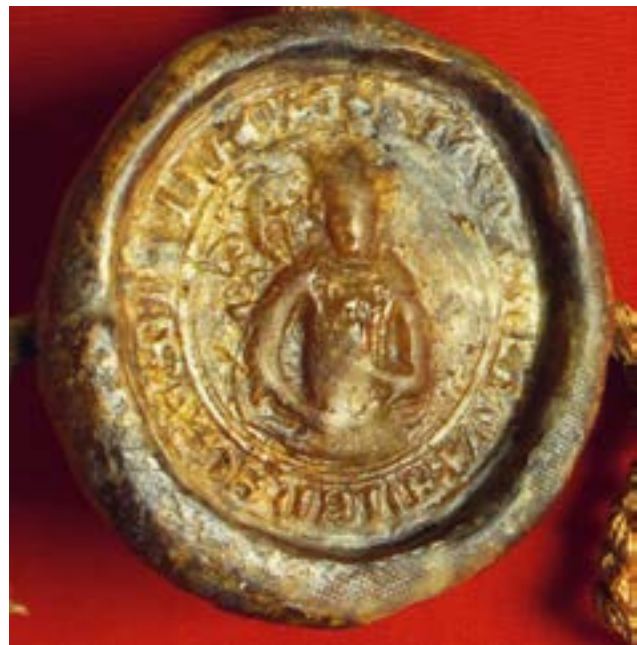
A váradi székeskáptalan 1291 és 1557 között használt nagypecsétje

Egy nagy, vasalt láda következett. Nem egyértelmű, hogy az utána sorakozó többnyire kisméretű, törékeny tárgyak, maradványok, töredékek ebben a ládában voltak-e. Ezüsfüstölő, nyolc aranyozott ezüstkehely, paténástul, három ezüstkehely, egy kis ezüstkéz, két, ezüsttel kombinált (complicata) kristálymonstrancia, egy drágakövekkel ékesített mitra. Egy kicsi dobozban kristálykövek és üvegek voltak, talán lehullott maradványok, talán egy nagyobb nemesfém-begyűjtő akció emlékei, mint az esztergomi kincstár 1549-ben, Pozsonyban felvett inventáriumában szereplő ereklye-gyűjtemény (zsákocskányi, üveg-kristálytokokba foglalt, vagy papírba csomagolt csontokkal). Ugyanitt tárolták a püspöki trónus tartozékait. Egy másik kicsiny dobozban a gyöngyhímzéses kazulákról lehullott virágokat gyűjtötték