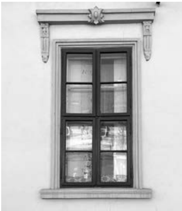
A 18. századi ablaktípus

utca néhány megmaradt 19. század eleji „parasztbarokk”, vagyis ívelt oromfalas homlokzata jól szemlélteti a különbséget a műemléki és a gondatlan, esetleges felújítások között. A 41. számnál az eredeti ablakok mintájára készítettek hőszigetelő ablakokat. A 49. és 51. számú házak viszont a sorozatos gondolatlan cserék (új, műanyag, osztatlan ablakfelületek; vonalas vakolatdíszek elsimítása) miatt már nem emlékeztetnek régi önmagukra.