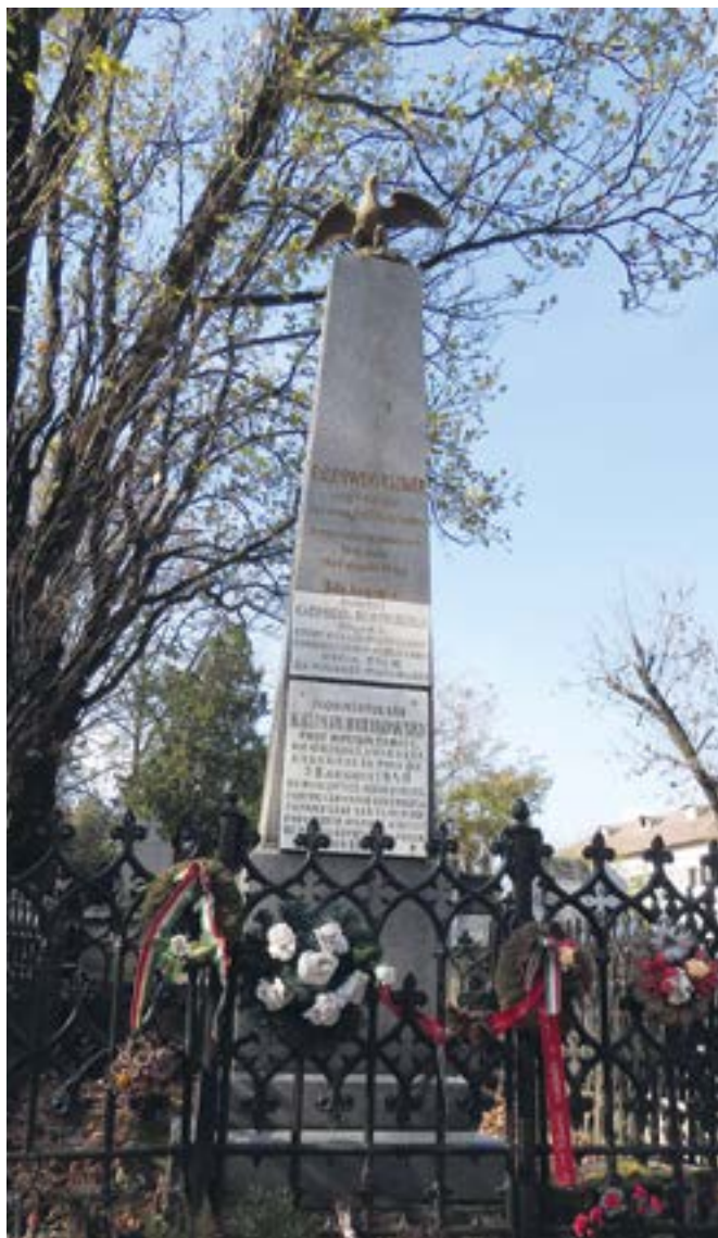
Rulikowski obeliszkje a nevét viselő nagyvárad köztemetőben

megerősíthetett. Az orosz hadbírósi tárgyalás jegyzőkönyve egyébként mindeddig nem került elő.)