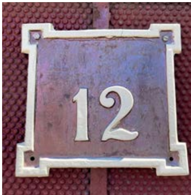
A 19. század végi házzám-tábla-típus

resni a városban. A Beöthy Ödön utca 39. számú ház táblája sokat megmutat nekünk a 20. század utolsó évtizedeinek hangulatából: nemzeti színekkel díszítve reprodukálta valaki a század eleji házzám-táblák formáját – műanyagból.