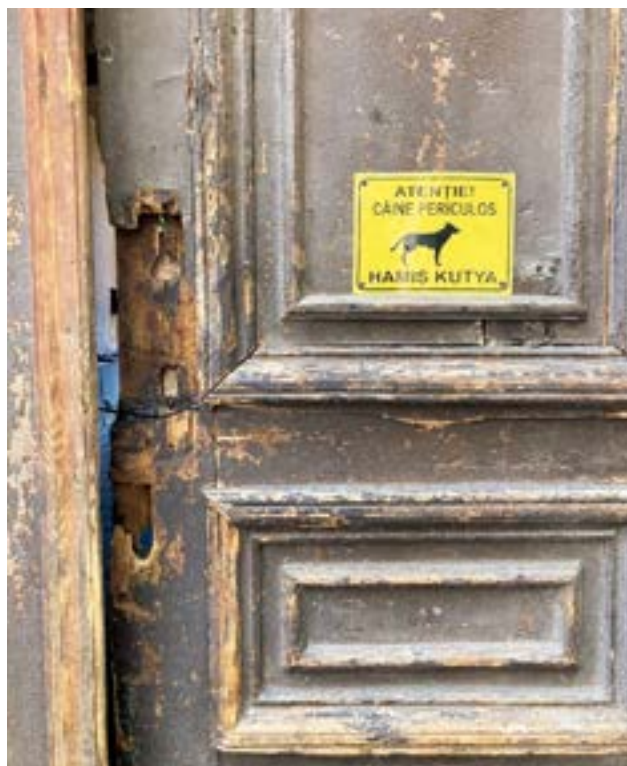
Leromlott állapotban lévő historista kapu

(Traian Moșoiu) és Kőfaragó (Nicolae Jiga) utcákat is, Váralját, Olaszit és Újvárost is. Mára leginkább szerényebb és kései változataik maradtak, olyan félreeső utcákban, mint a Tímár (Plevnei), vagy a Szacsavay (Cuza Vodă), és a Szent János (Ady Endre) utca külső szakaszai. A Kapucinus utcában, illetve a Kolozsvári úton még egy-egy ilyen kapu áll.