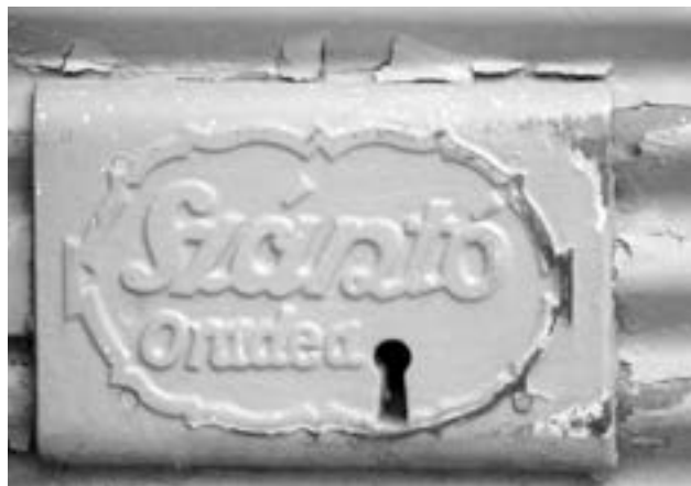
Két világháború közötti redőnybélyeg (Pavel utca, Gör. kat. Püspökség bérháza)

homlokzati elemként. Fontos lenne a felújításokkor nagyobb figyelmet szentelni az eredeti lábazatok megtartásának és megfelelő pótlásának. A Beöthy Ödön (Iuliu Maniu) utca 28. számú házában szakszerű felújítás történt, a klinker téglát homokfúvással tisztították meg, majd látták el fedő-impregnáló lakkréteggel. Ugyanezen az utcán a 11. szám alatt, illetve a Ritoók Zsigmond (George Enescu) utca 8. szám alatti négytengelyes házon ugyanezt a típusú téglát amatőr módon lemázolták. A Szent János (Ady Endre) utca 19 szám alatti egyemeletes modernista/art deco bérház sötét-szürke műkölabazatára pótlásul a fal síkjába szinte teljesen belesimuló szürke csempét tettek, ezzel változtatva meg a homlokzat egyszerű, de ízléses arányait, felületeik matt, visszafogott fényét. Vakolatból készült lábazatot már szinte alig találunk a városban, ha ezek még is eredeti anyagukat mutatják, akkor azt rendkívül rossz állapotban.