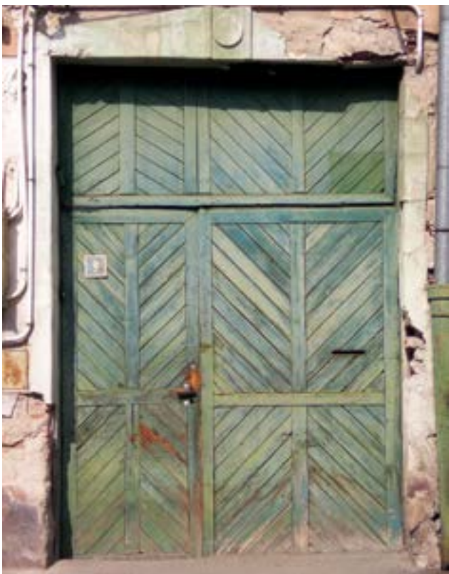
A provinciális barokkot idéző 19. századi kaputípus

Várad legrégebbi kapui, elsősorban a 19. század elejéről maradtak ránk, nem olyan régiek tehát, mint a legtöbb erdélyi városban megmaradt műemléki védettséget érdemlő kapuelemek. A kaputípus viszont őrzi a 18. századi hagyományt: a párhuzamosan, keresztben, vagy sugarasan elhelyezett lécekből ácsolt felület fő díszítőeleme éppen ez, a lécek által létrehozott geometrikus minta. Egykor ilyen kapuk díszítették a Kapucinus