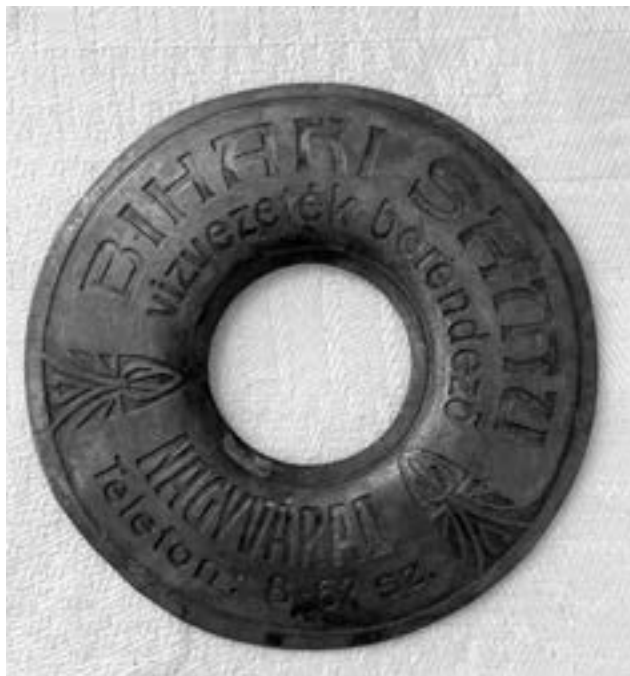
Rézből készült vízvezeték-szerelői reklámtárcsa