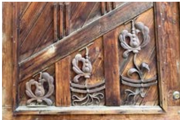
Eredeti szecessziós elemek egy új kapun

A műemlékvédelmi értéket képviselő kapuk közül ezekből az általában keményfából készült kapukból találunk a legtöbbet a városban. Ezek javarészt kettes vagy hármasszázadosak, de ilyen