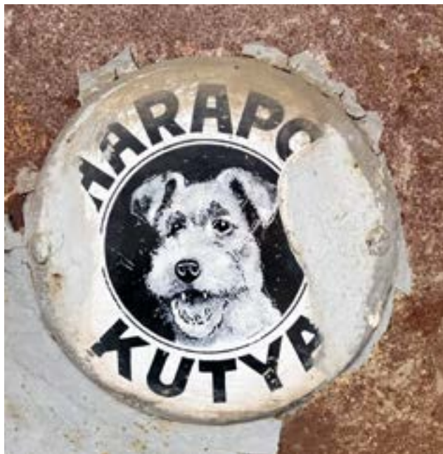
Házőrzőre figyelmeztető tábla a két világháború közötti korszakból