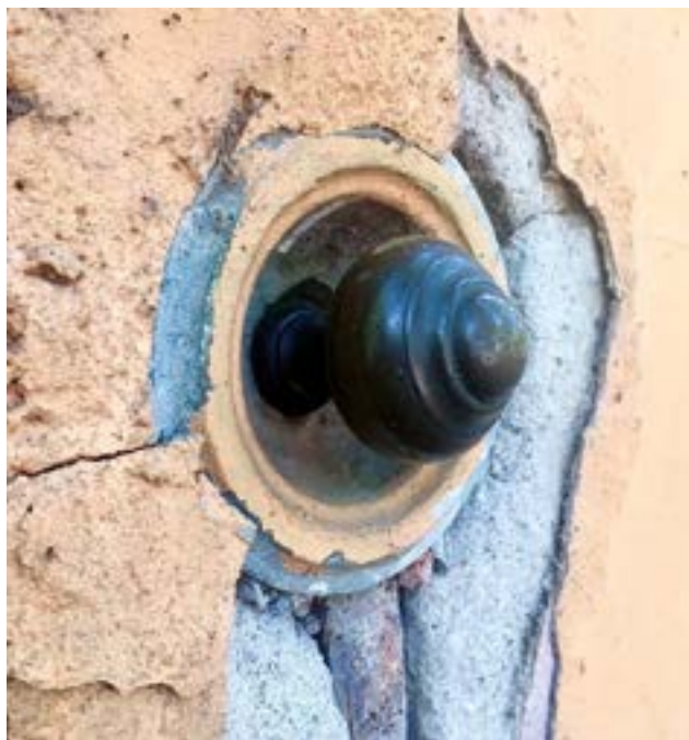
Mechanikus csengő a Schlauch kertből

Ezeknek az elfeledőben lévő részleteknek 9 a helyzete azért is figyelemre méltó, mert a rájuk való odafigyelésünkön lehet próbára tenni közös- ségünk állapotát. Analóg ez a szellemi öröksé- günkkel, történelmünk ismeretével is. Bár a váradi polgárság számára mindig is természetes volt, most felnövőben van Nagyváradon az első itt szü- letett generáció, amely nem használja, de még csak nem is ismeri a régi utcaneveket. Pedig az ott- honlétünk, a város sajátunkként való megélésé- nek alapvető eleme az a szóbeli hagyomány, amely nem cinkosokká, inkább a saját tereit belakó, törté- nelmét és mindennapjainak történetét ismerő közösséggé formálta a váradi lakosokat – elsősor- ban a magyar, de a román lakosságot is – az utóbbi száz évben. A közösségünk által felhalmozott tudás biztonságadó élményének elvesztése miatt lesz nagy veszteség, ha elfelejtjük a Zöldfa utca középkori eredetű névadást tanúsító nevét, a szür- külő kolostorfalak történetére pedig még a Kapucinus utca neve sem emlékeztet majd senkit. Szegényebbek leszünk, ha már nem jut eszünkbe