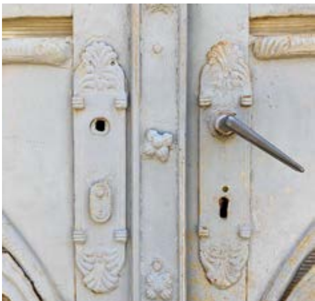
Szeccszíós kilincspajzsok a Szilágyi Dezső utcában

A Szent János utca 32. szám alatti szeccszíós kirakatdíszítés a huszadik század 90-es éveiben, vagy a kétezres években készülhetett. Itt néhány megmaradt elem viszont arra utal, hogy a minta, ami alapján gyártották, maga az eredeti kirakat volt. Az illesztések minőségén, az arányokon, a szegelésen és az elemek vastagságán látszik, hogy ez egy újragyártott kirakat. Erre bizonyítéku szolgál, egy egykori mezőtelegi patika nagyjából eredeti állapotban megmaradt bejárata, ezzel összehasonlítva válik nyilvánvalóvá, hogy a Szent János